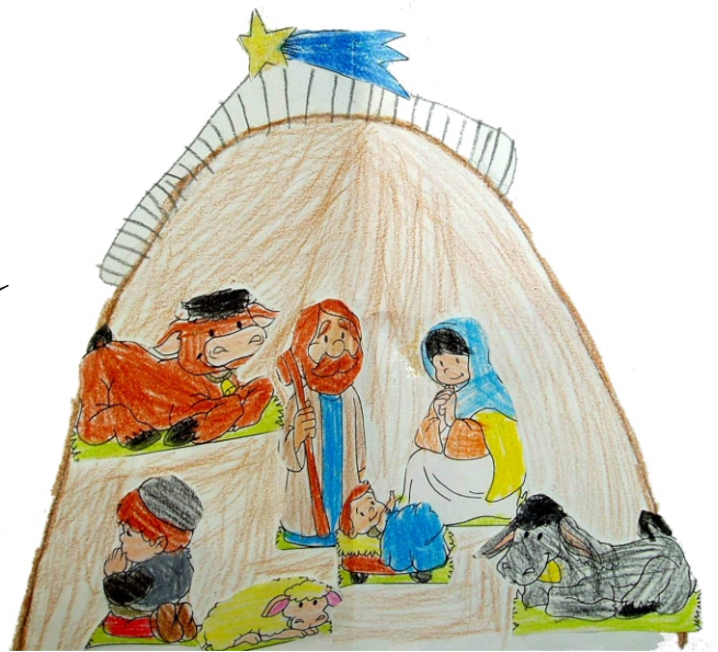
Belén pintado por los niños de la catequesis

La comunidad está llena de vida y en estos últimos años nuestros hijos e hijas se han multiplicado. Como no podía ser de otra forma nos "exigen" y "obligan" a alimentarlos y cuidarlos en todas sus facetas. Es una alegría vivir en comunidad su despertar religioso y contar con hermanos que los acompañan.