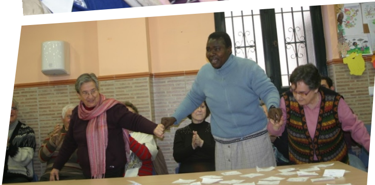
"Primer encuentro Interfranciscano de Andalucía Oriental" Casa de los Hermanos de la Cruz Blanca (Granada) 21/01/2013

Este mes de febrero comenzaremos la cuaresma, tiempo de conversión y preparación para la Pascua del Señor. Estas son las actividades que tenemos previstas: