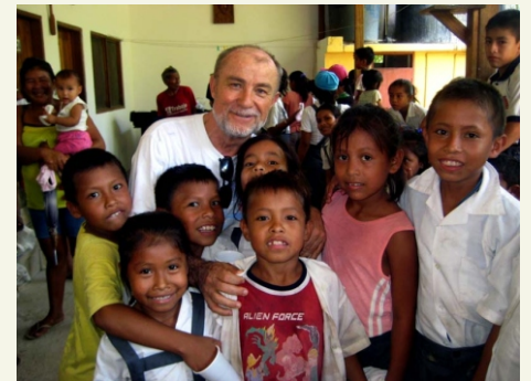
Ministerio de Misiones

Quizás, lo que resulta más llamativo, en contraste con la mayoría de aldeas que hemos visitado hasta ahora, es que Flor de Punga dispone de agua potable y calles pavimentadas, algo que resulta fundamental en términos de salud pública e individual, y que, aunque puede parecer simple, la verdadera realidad es que, en este medio, es algo muy complicado de conseguir, y lleva detrás de sí la historia de un gran esfuerzo.