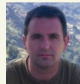
Clemente Grupo de Oración

A Tí Padre te buscamos en el silencio, en la lluvia, en el camino en los hermanos. A Tí te contemplamos en la oración comunitaria, donde nos ponemos en camino hacia la misión de la Iglesia Universal. A Tí Padre te encontramos en la persona de San Francisco que nos habla hoy a nosotros, como lo hizo con sus seguidores: Que la paz que anunciáis de palabra, la tengáis, y en mayor medida, en vuestros corazones.