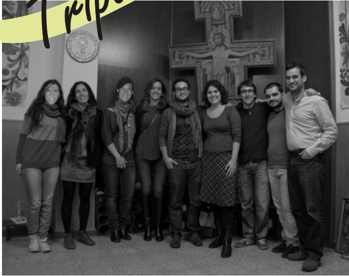
Bienvenidos a la Comunidad Fraterna Grupo Raíces