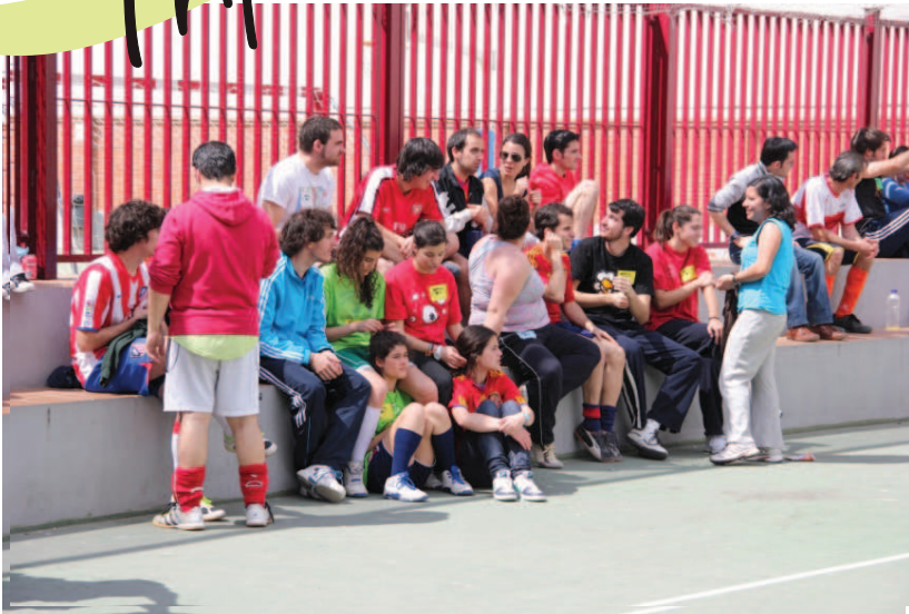
XIX Métele un gol a la droga 30/03/2012

Este mes de pascua tenemos muchísimas actividades para acercarnos al Señor, compartiendo y disfrutando con los hermanos. Os presentamos las más relevantes: