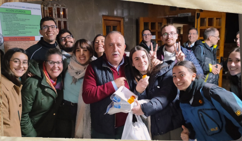
JORNADA DE DESIERTO 11/11/23