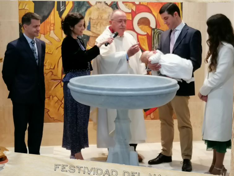
FESTIVIDAD DEL NACIMIENTO DE SEVE 26/11/23