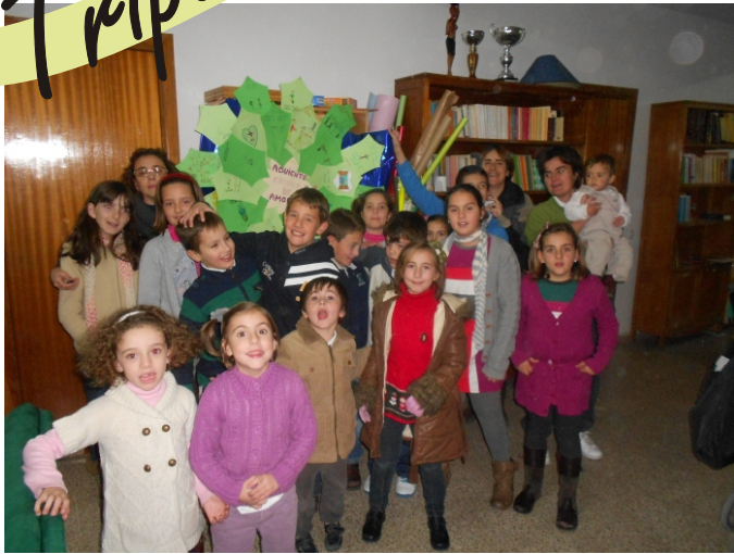
Los niños de la Comunidad con sus catequistas en el retiro de Adviento (01/12/12)

Para la Navidad y el mes de enero tenemos también unas cuantas actividades que nos acercan al Señor. Os contamos cómo participar: