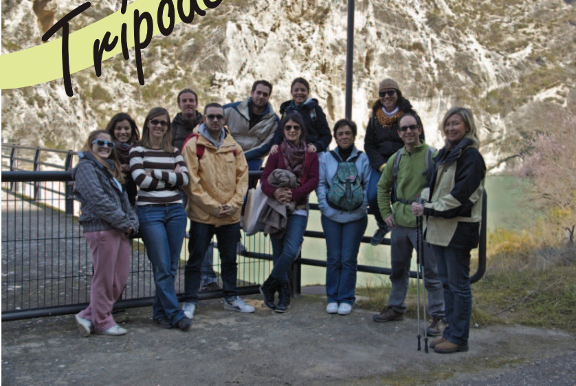
Convivencia del grupo de catequistas 2 y 3 de marzo de 2012

Este mes tenemos como centralidad la celebración de la Pascua de nuestro Señor. En comunidad nos juntamos en diversos lugares de Andalucía para así profundizar en el misterio de nuestra vida como cristianos. Aquí tenemos las actividades más importantes de este mes: