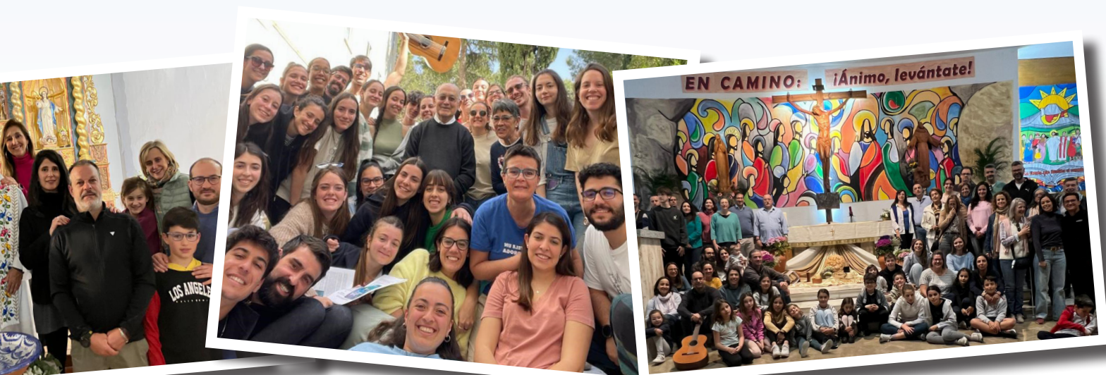
Pascua de Cortes de Baza