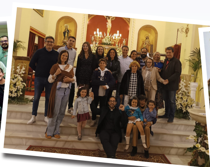
Pascua de Válor