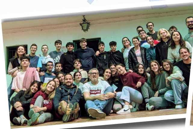
Pascua de Monachil

A nosotros nos pide el Concilio Vaticano II que ofrezcamos en la liturgia una participación «plena, activa y comunitaria». No solo somos oyentes en la celebración, sino también participantes y actuantes gozosos de lo que celebramos, con hermanos iguales en dignidad por el bautismo. Somos hijos del Dios Padre, hermanos de Dios Hijo, y comunión del Dios Espíritu. Todos participamos en el gran Misterio-Revelado en plenitud en la Pascua; donde ya no tenemos miedo ni dolor,